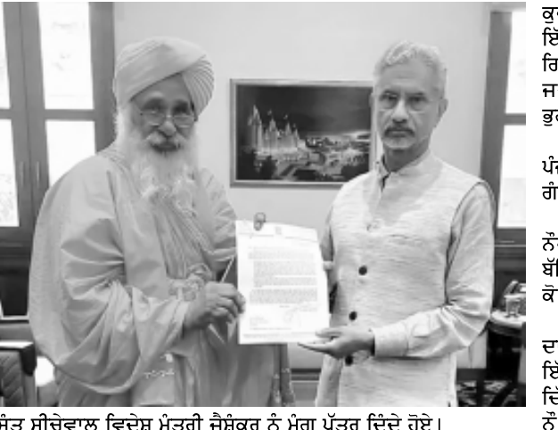
ਸੰਤ ਸੋਚੇਵਾਲ ਵਿਦੇਸ਼ ਮੰਤਰੀ ਜੈਸ਼ੰਕਰ ਨੂੰ ਮੰਗ ਪੱਤਰ ਦਿੰਦੇ ਹੋਏ।

ਲੋਹੀਆਂ ਖਾਸ-ਵਿਦੇਸ਼ ਦੀ ਜੇਲਾਂ 'ਚ ਫਸੇ ਪੰਜਾਬੀ ਲੜਕਿਆਂ ਨੂੰ ਰਿਹਾਅ ਕਰਨ ਲਈ ਰਾਜ ਸਭਾ ਮੈਂਬਰ ਸੰਤ ਬਲਬੀਰ ਸਿੰਘ ਸਰਹੱਦੀ ਅਤੇ ਫੌਜ ਮੰਤਰੀ ਜੈਸ਼ੰਕਰ ਨਾਲ ਮੁਲਾਕਾਤ ਕੀਤੀ। ਸੰਸਦ ਸੈਨਣ ਦੇ ਦੌਰਾਨ ਸੰਤ ਸੋਚੇਵਾਲ ਨੇ ਵਿਦੇਸ਼ ਮੰਤਰੀ ਨੂੰ ਵੱਖ ਵੱਖ ਦੇਸ਼ਾਂ ਦੀ ਜੇਲਾਂ 'ਚ ਫਸੇ ਪੰਜਾਬੀਆਂ ਨੂੰ ਬਾਹਰ ਕੱਢਣ ਲਈ ਮੰਗ ਪੱਤਰ ਵੀ ਦਿੱਤਾ। ਸੰਤ ਸੋਚੇਵਾਲ ਨੇ ਕਿਹਾ ਕਿ ਵਿਦੇਸ਼ ਮੰਤਰੀ ਨੇ ਉਨ੍ਹਾਂ ਵਲੋਂ ਚੁੱਕੇ ਗਏ ਮੁੱਦਿਆਂ ਨੂੰ ਧਿਆਨ ਨਾਲ ਸੁਣਿਆ ਅਤੇ ਉਨ੍ਹਾਂ ਨੂੰ ਭਰੋਸਾ ਦਿੱਤਾ ਕਿ ਭਾਰਤੀਆਂ ਨੂੰ ਜੇਲਾਂ ਤੋਂ ਸੁਰੱਖਿਅਤ ਕੱਢਣ ਦਾ ਯਤਨ ਕੀਤਾ ਜਾ ਰਿਹਾ ਹੈ।