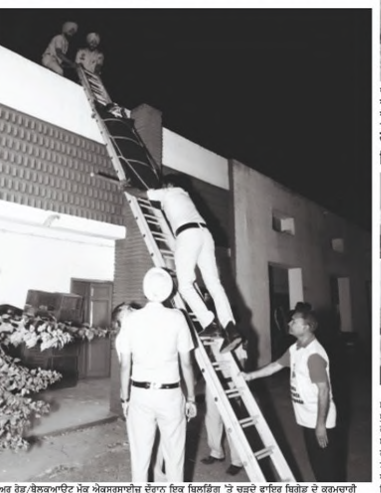
ਏਅਰ ਰੇਡ/ਬਲੈਕਆਊਟ ਮੌਕੇ ਐਕਸਰਸਾਈਜ਼ ਦੌਰਾਨ ਇਕ ਬਿਲਡਿੰਗ 'ਤੇ ਚੜ੍ਹਦੇ ਫਾਇਰ ਬ੍ਰਿਗੇਡ ਦੇ ਕਰਮਚਾਰੀ